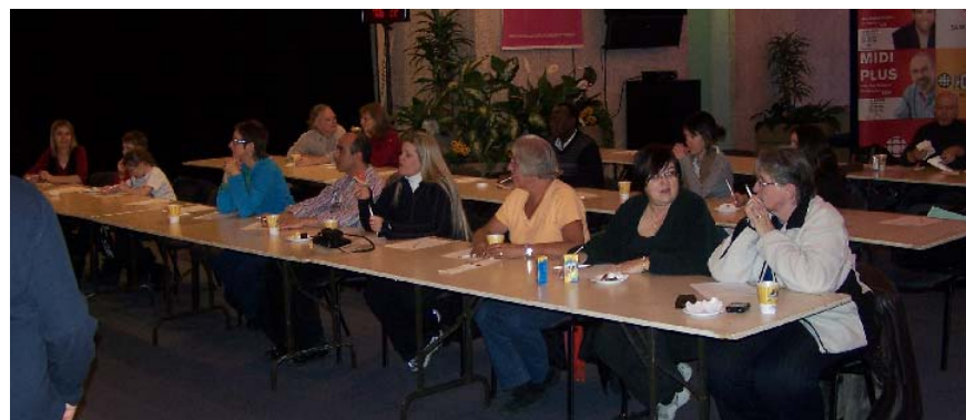
Participants de la Grande dictée pour la région de Regina dans les studios de Radio-Canada

Au total, 215 personnes ont participé à la Grande dictée, organisée en collaboration avec Radio-Canada, le mardi le 17 mars, dont la diffusion a été faite à partir de la Galerie de Radio-Canada, à Regina. Vingt-trois communautés à travers la province étaient inscrites à cet événement littéraire.